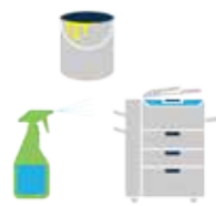
Sustancias Químicas (Compuestos químicos volátiles, humo de tabaco, polución)