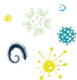
Bacteria / Virus